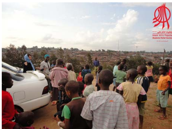
جمعیت امداد دانشجویی - مردمی امام علی (ع)